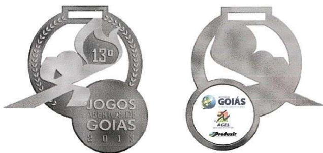
9cm de altura