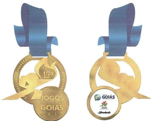
9cm de altura