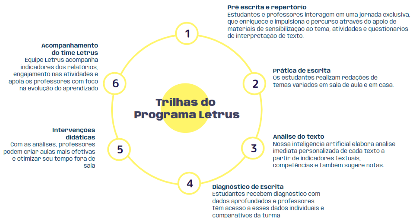
Diagrama 1 - Trilhas Pedagógicas do Programa Letrus